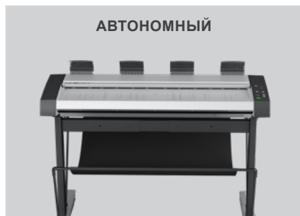
Сканирование с удаленного ПК