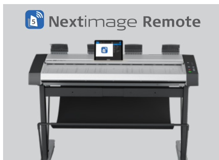
Дистанционное управление ПО Nextimage с планшета