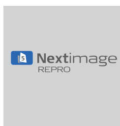
Software Nextimage REPRO