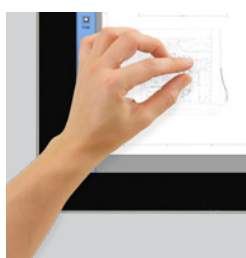
Tela de toque Tela de toque Full HD de 21,5"