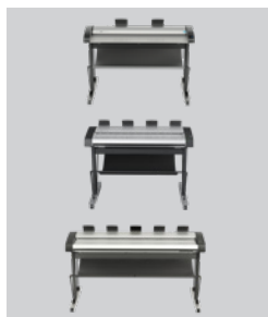
Wybrany przez klienta skaner IQ Quattro X 44 cale HD Ultra X 42 cale HD Ultra X 60 cali