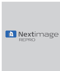
Oprogramowanie Nextimage REPRO