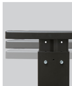
Stanowisko o regulowanej wysokości