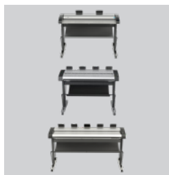
Seu scanner escolhido IQ Quattro X 44 pol. HD Ultra X 42 pol. HD Ultra X 60 pol.