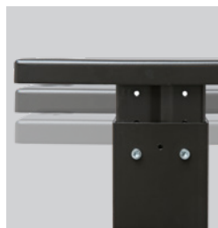
Conjunto de altura ajustável