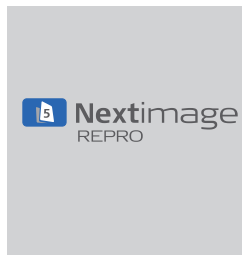
Software Nextimage REPRO