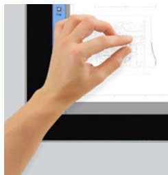
Pantalla táctil Pantalla táctil Full HD de 21,5"