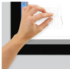
Écran tactile Écran tactile full HD 21,5 pouces