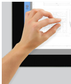
Touchscreen Voll-HD-Touchscreen mit 21,5 Zoll