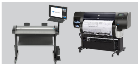
Support en version basse disponible pour un fonctionnement côte à côte