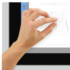
Aplicación Windows estándar o modo pantalla táctil intuitivo