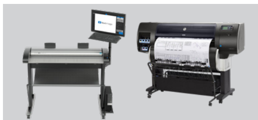
Existe una versión con un soporte inferior para colocar la impresora al lado