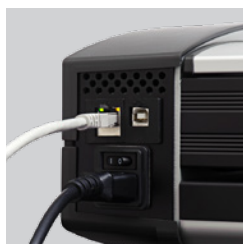
Copia a un número ilimitado de impresoras a través de la red o de un USB