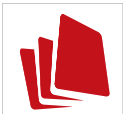
Escáneres HD Ultra para una productividad alta y una calidad sin igual

Elija un ancho de 36 o 42 pulgadas, cada uno con tres configuraciones diferentes. Disponible como una solución ScanStation completa, con software, pantalla táctil y soporte ergonómico.