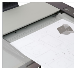
Apoye los documentos con las guías de alimentación de papel