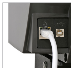
Mejor ancho de banda del sector, con Gb Ethernet y xDTR2