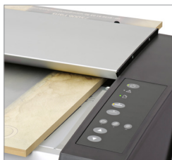
Digitalice originales gruesos con el control de grosor automático (ATAC)