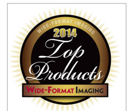
Contex HD Ultra se premió como el Mejor escáner de gran formato por tercer año consecutivo