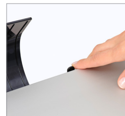
Ajuste la presión del papel fácilmente para proteger los documentos frágiles