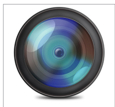
CCD de Contex con ALE garantiza una precisión de 0,1 %

Los escáneres HD Ultra son para clientes que exigen una alta capacidad de proceso una gran flexibilidad y un rendimiento inigualado.