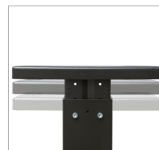
Soporte de alto ajustable para una ergonomía óptima