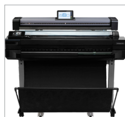
Soporte alto opcional para colocarlo sobre la impresora