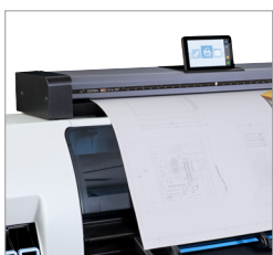
SD One MF es lo suficientemente ligero para colocarse sobre cualquier superficie plana o sobre un soporte bajo opcional.

SD One MF resulta perfecto para situaciones en las que necesite distribuir costes, ya que integra un software de gestión de impresión, que le permitirá controlar el coste de cada escaneado, copia o impresión.