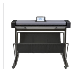
Soporte bajo para colocarlo junto a la impresora